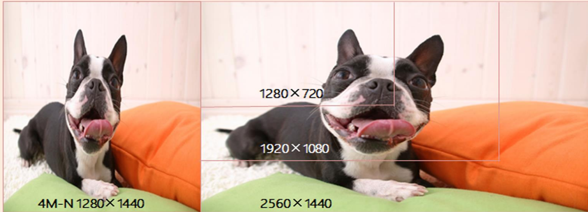
IMAGEN CON CALIDAD SIMILAR A 4MP CON BIT RATE DE 1080P